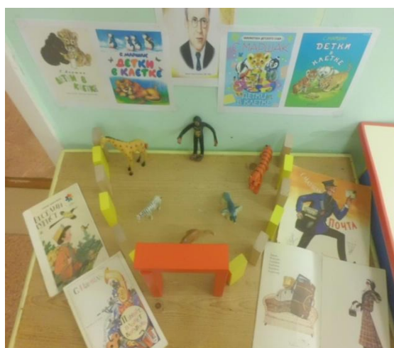
Выставка «Чьи стихи мы знаем с детства» Выставка по произведениям С.Я.Маршака

Утром в детском саду детей встречал почтальон из стихотворения «Почта». Он поздравил детей с юбилеем любимого писателя, познакомил с его жизнью, творчеством и увлек ребят в веселую и озорную литературную викторину. Дети отгадывали загадки Маршака, выполняли задания «Доскажи слово», «Чьи слова?», «Вспомни стихотворение», «Разгадай кроссворд». Викторина вызвала у детей большой интерес и положительный эмоциональный отклик.