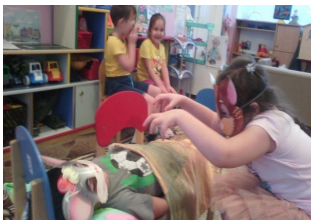
Мини-спектакль «Сказка о глупом мышонке»

Все свои впечатления от прошедшего дня дети выразили в рисунках и беседах. Они рисовали понравившихся героев произведений С.Я.Маршака и беседовали об основных нравственных ценностях, заложенных в произведениях писателя.