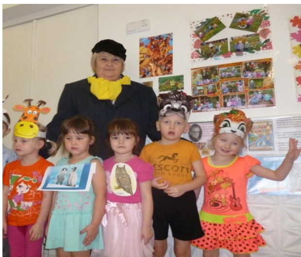
Мини-спектакль «Детки в клетке»