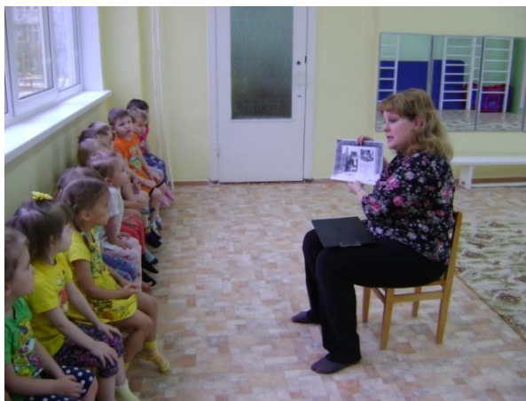
Беседа по произведению «Усатый полосатый»

Проведённое мероприятие способствует популяризации творческого наследия С. Я. Маршака и повышает интерес детей и взрослых к чтению произведений детского писателя.